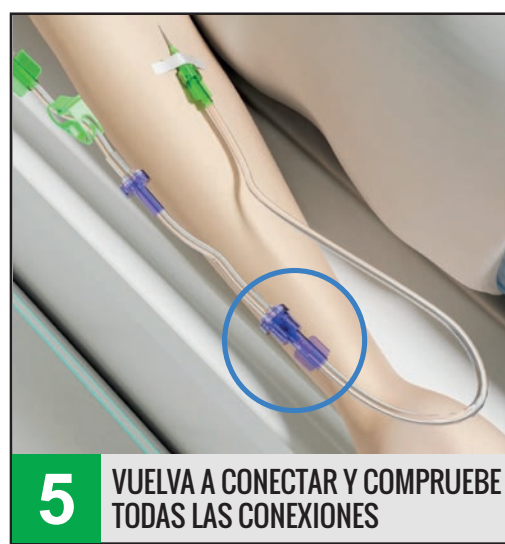
5 VUELVA A CONECTAR Y COMPRUEBE TODAS LAS CONEXIONES