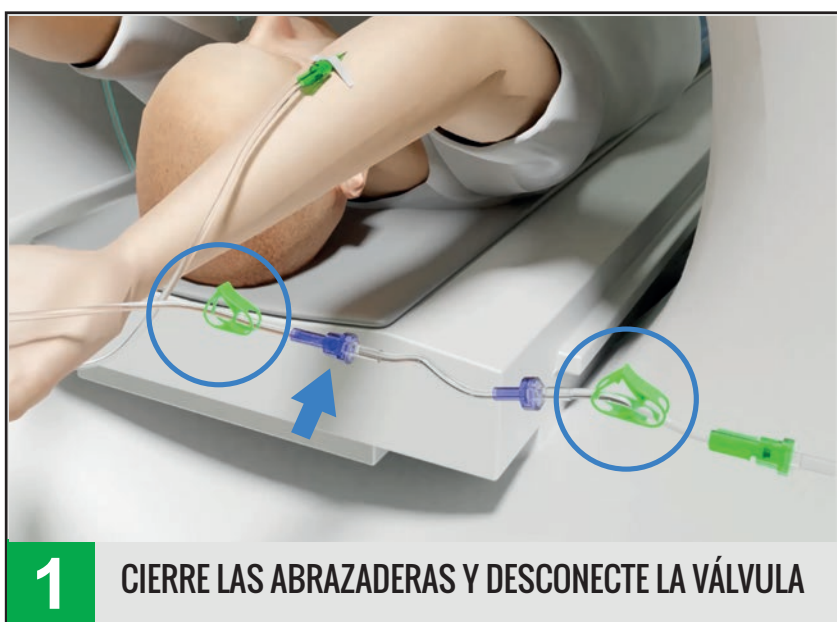
1 CIERRE LAS ABRAZADERAS Y DESCONECTE LA VÁLVULA