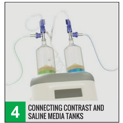
4 CONNECTING CONTRAST AND SALINE MEDIA TANKS