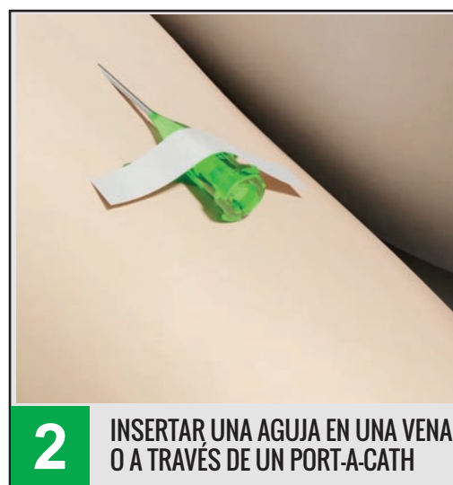
2 INSERTAR UNA AGUJA EN UNA VENA O A TRAVÉS DE UN PORT-A-CATH