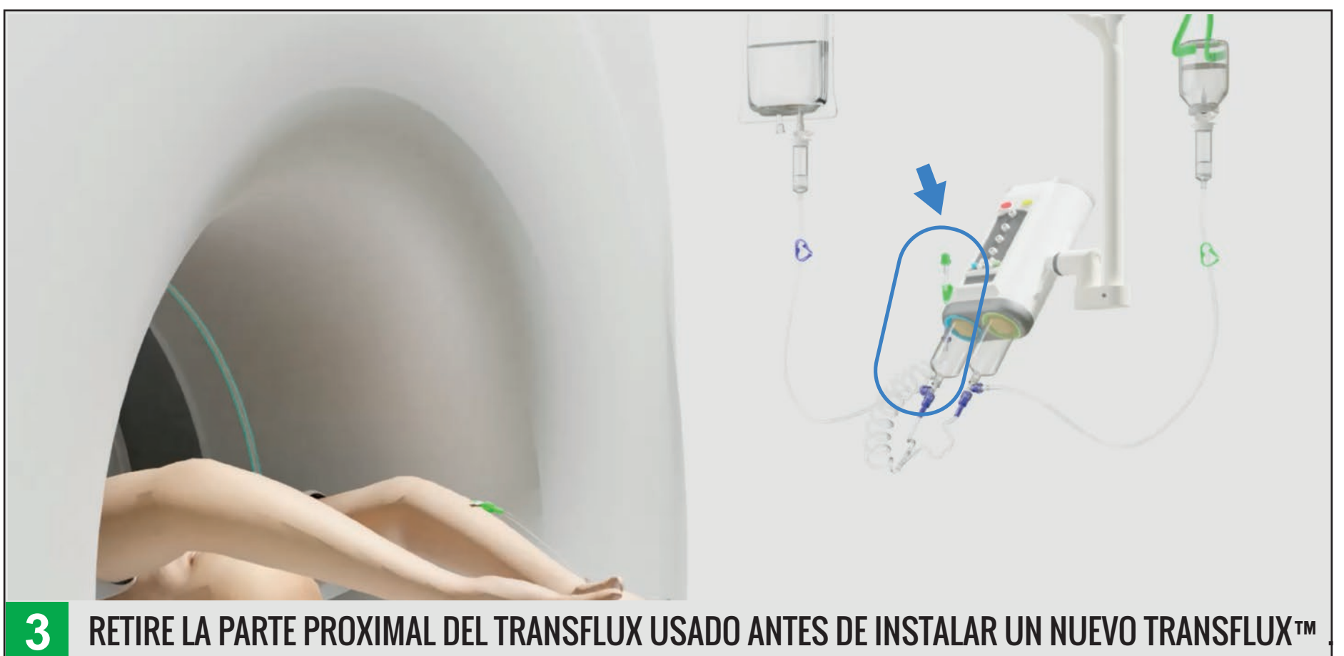
3 RETIRE LA PARTE PROXIMAL DEL TRANSFLUX USADO ANTES DE INSTALAR UN NUEVO TRANSFLUX™