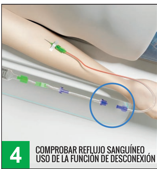
4 COMPROBAR REFLUJO SANGUÍNEO USO DE LA FUNCIÓN DE DESCONEXIÓN