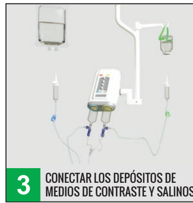
3 CONECTAR LOS DEPÓSITOS DE MEDIOS DE CONTRASTE Y SALINOS