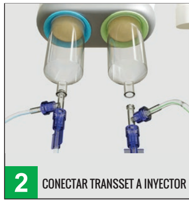
2 CONECTAR TRANSET A INYECTOR