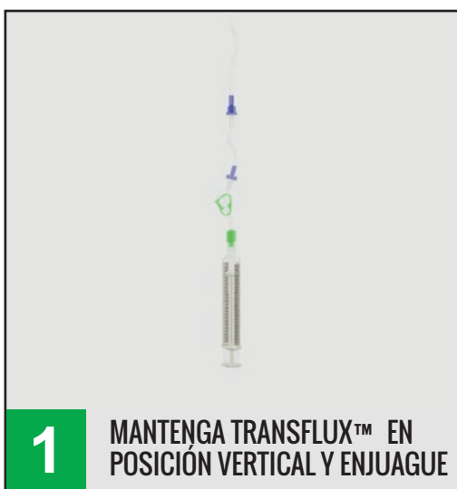
1 MANTENGA TRANSFLUX™ EN POSICIÓN VERTICAL Y ENJUAGUE