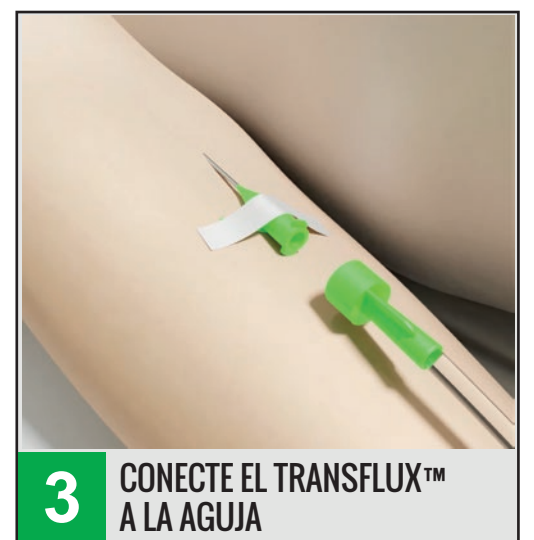
3 CONECTE EL TRANSFLUX™ A LA AGUJA