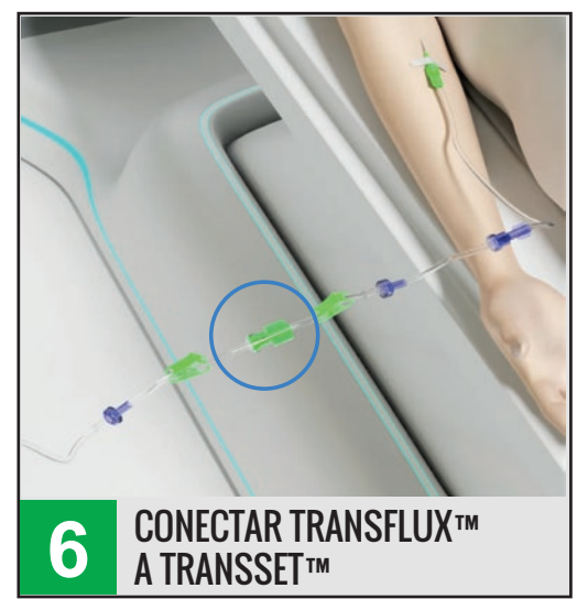
6 CONECTAR TRANSFLUX™ A TRANSET™