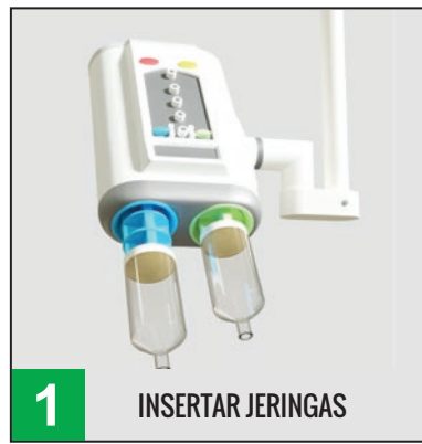
1 INSERTAR JERINGAS